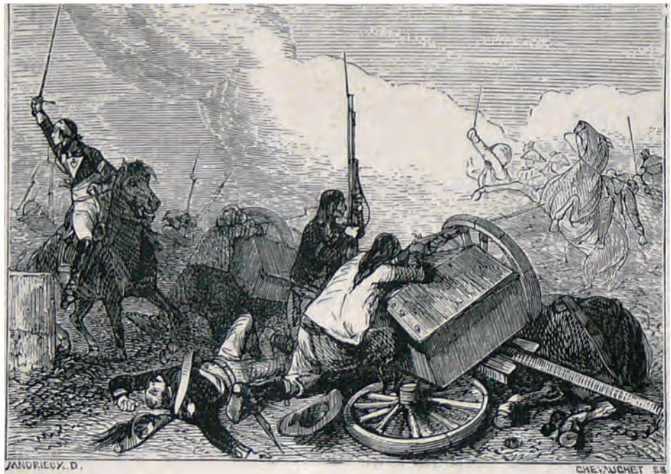
"Ceux-ci (les Bleus) confondus du courage de ces paysans, qu'ils regardaient comme vaincus d'avance par leur ruse, sont culbutés et s'enfuient à Doué dans une déroute complète, abandonnant plusieurs canons."