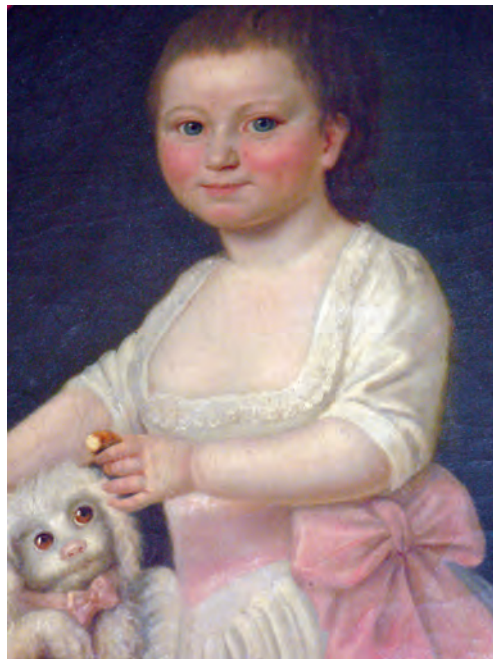
La marquise enfant .

Le lendemain matin, il se trouva presque le nombre promis, des