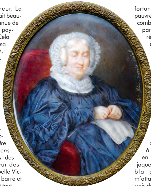
La Marquise en "grand-mère au tricot" : elle s'occupera activement des dossiers d'aide aux Vendéens, anciens combattants de la guerre de Vendée.

Commentaires : Traquée pendant toute l'année 1794, elle a dû la vie à la solidarité du peuple et elle a perdu ses préjugés aristocratiques. Elle se présente habillée en servante mais forte de son indignation devant les héritiers des Terroristes. Et voilà que ceux-ci réalisent qu'elle est autre chose qu'une simple paysanne, même s'ils ne savent pas réellement qui elle est. On sent aussi chez eux une certaine culpabilité d'avoir persécuté tant de nobles, et une obséquiosité voilée, retransmise avec un humour pince-sans-rire par la Marquise.