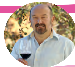
Par Marc Vigneron, dégustateur professionnel au Longeron (49)