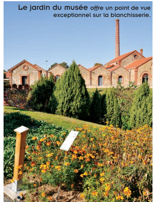
Le jardin du musée offre un point de vue exceptionnel sur la blanchisserie.

d'où vient l'inimitable rouge du mouchoir de Cholet : c'est la racine de la garance qui, coupée et bouillie, donne cette couleur rouge si intense. La garance était également connue pour ses vertus antiseptiques, c'est ainsi qu'elle servit pour la teinture... des pantalons rouges des Poilus ! En cas de plaie, on osait espérer que la fibre du pantalon pourrait apaiser les souffrances du blessé... Au final, c'est surtout l'ennemi qui, voyant ces soldats de loin, s'est réjoui de ce choix !