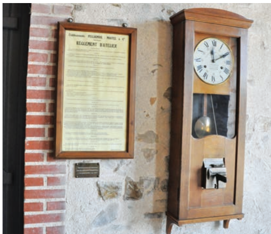
Le règlement intérieur et la pointeuse, symboles de l’industrialisation du métier de tisserand.

Salle des cuves, salle de la machine à vapeur, salle des sèches, salle des fibres... la visite se poursuit au cœur de la blanchisserie et c’est un véritable plongeon dans l’histoire du textile. La salle des cuves – incroyablement bien conservée – livre les secrets du blanchiment des toiles, plongées tour à tour dans du chlore, de l’acide muriatique et de l’eau. “Ces toiles étaient ensuite étendues sur prés. Imaginez qu’ici, nous étions entourés d’immenses champs, c’était la campagne et on voyait les prairies de loin, entièrement recouvertes de linges immaculés” .