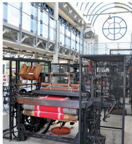
La salle du Crystal Palace accueille les visiteurs pour des démonstrations qui font “chanter les métiers à tisser”.

Dans la salle des fibres, on trouve une impressionnante collection de rouets servant au filage du chanvre, du lin et de toute autre fibre, comme ce rouet qui, quand on le plie, se transforme en valisette... Son nom ? Le rouet de Gandhi, symbole de la revendication du philosophe indien.