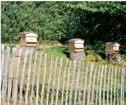
Depuis 2010, le jardin accueille trois ruches.

Cette promenade dans le jardin est également l'occasion d'apprendre