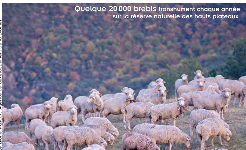
Quelque 20 000 brebis transhumant chaque année sur la réserve naturelle des hauts plateaux.

• Agence du développement du tourisme de la Drôme au 04 75 82 19 26 ; info@ladrometourisme.com ; www.ladrometourisme.com .