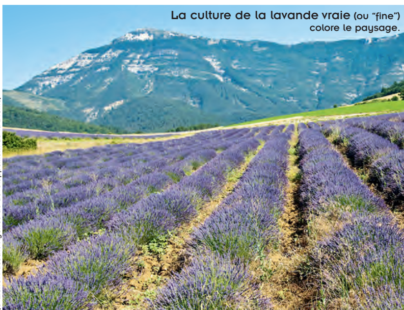
La culture de la lavande vraie (ou "fine") colore le paysage.