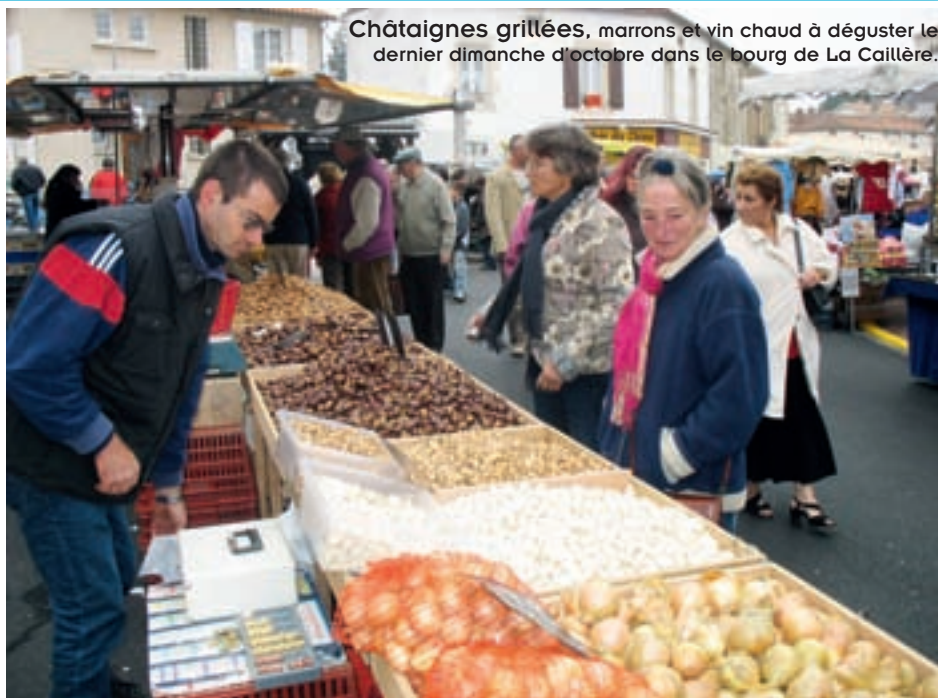
Châtaignes grillées, marrons et vin chaud à déguster le dernier dimanche d'octobre dans le bourg de La Caillère.

Exode rural, enclavement et activité économique essentiellement agricole... Il a fallu l'effort commun des élus, dans l'intérêt général, pour faire changer les choses." Et la première réussite reste, bien entendu, le Vendéopôle.