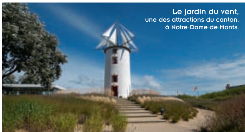
Le jardin du vent, une des attractions du canton, à Notre-Dame-de-Monts.

démonstration, on estime qu'à 80 %, les entreprises ont une activité liée au tourisme." Par comparaison, le pourcentage du chiffre d'affaires lié au tourisme du Pays du Pont d'Yeu, (le canton et l'île d'Yeu), est de 51 % contre 30 % au Pays des Olonnes et 29 % pour La Baule et la presqu'île guérandaise.