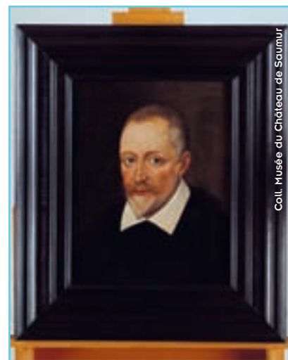
Portrait présumé de Philippe Duplessis-Mornay. France, anonyme, début XVII e siècle, Château-Musée de Saumur.

En 1599, cet éminent théologien qui parcourt l'Europe à 19 ans, fonde l'Académie du Protestantisme. Un lieu d'enseignement de réflexion de grande notoriété. On y vient de tout le vieux continent. Les imprimeries fleurissent et profitent de cette fécondité intellectuelle... Aujourd'hui, il reste peu de traces évidentes de ce