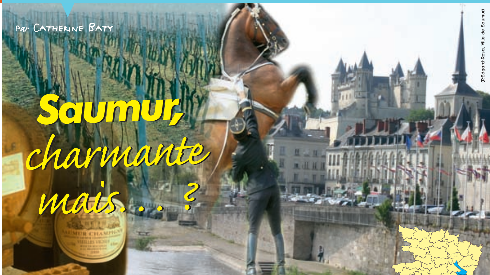
(P.Édgar-Rosa. Ville de Saumur)