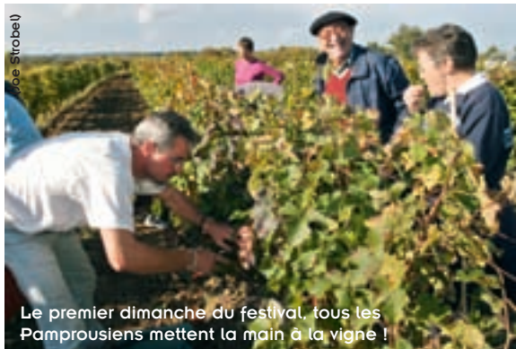
Le premier dimanche du festival, tous les Pamprousiens mettent la main à la vigne !

(1) Festival des vendanges de Pamproux, du 8 au 17 octobre. Renseignements au 05 49 76 31 23.